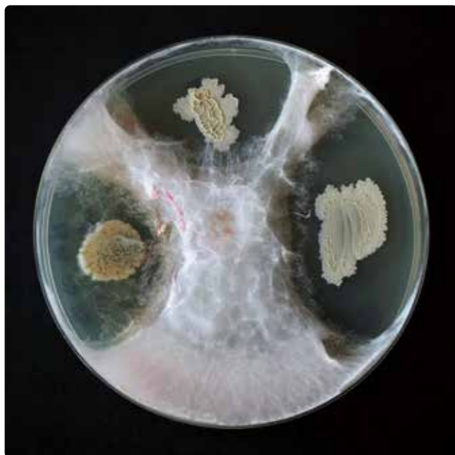
Ilustracijoje – grybinis ligų sukėlėjas nepatenka į zoną, kurioje yra Biomass PROTECT .