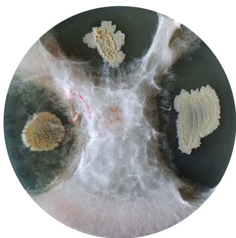
Pildil – Biomax PROTECT Leedus laialt levinud haigust tekitava patogeeni Fusarium culmorum vastu – haigustekitaja ei satu tsooni, kus Biomax PROTECT bakterid asuvad.