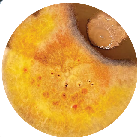
Pildil – Biomax PROTECT levinud haigust tekitava patogeeni Fusarium avenaceum vastu – haigustekitaja ei satu tsooni, kus asub Biomax PROTECT .